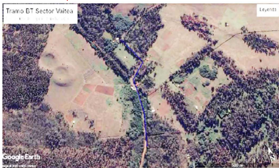
Figura 8. Construcción de 800 mts línea BT común con MT sector Vai Tea

Resp.: Se adjunta información complementa