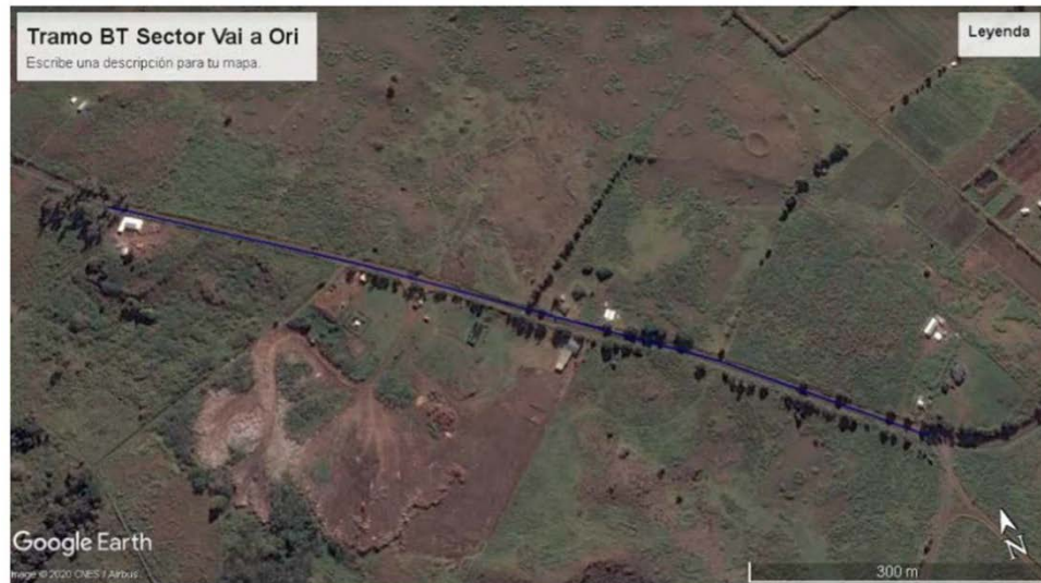
Figura 7. Construcción de 800 mts línea BT común con MT sector Vai a Ori

De figura 5 y Fig. 7, de Bases Técnicas, ambas muestran exactamente lo mismo pagina 8 y 9, pero con distintas descripciones, y en video este tramo de línea parte desde la ruta IPA-1. Dado estas incongruencias se consulta: