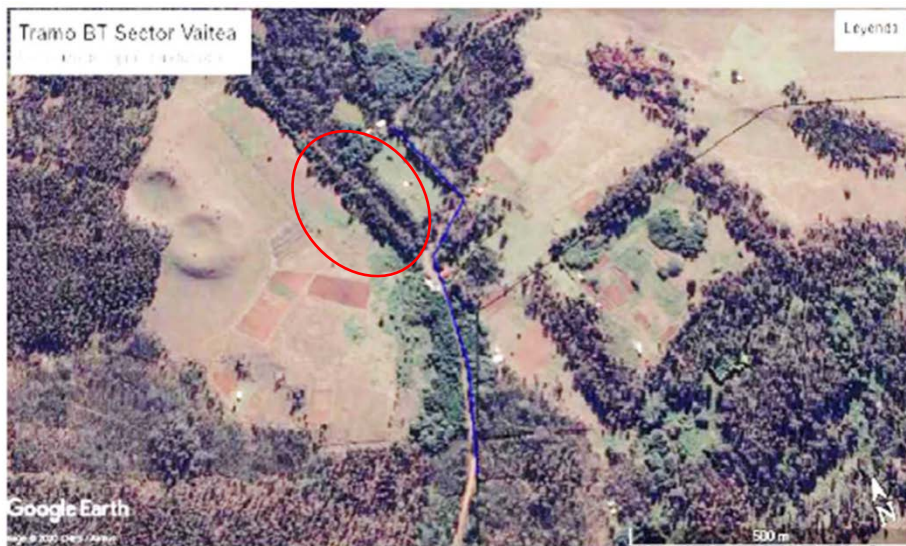
Figura 8. Construcción de 800 mts línea BT común con MT sector Vai Tea

Resp.: En la figura 8 en el círculo rojo se encuentra la postación común de MT y BT