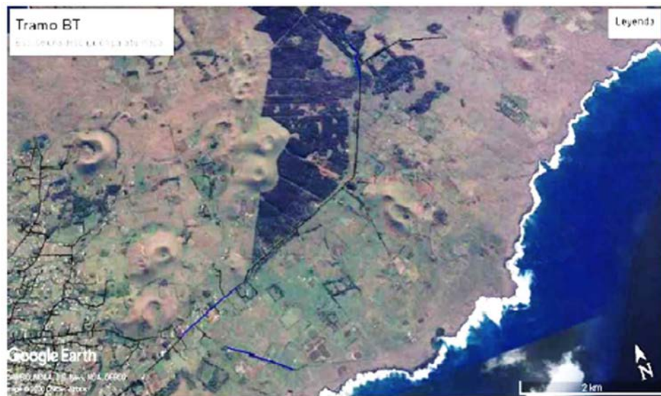
Figura 5. Construcción de 500 mts línea BT poste 9 mts sector Vai a Ori.