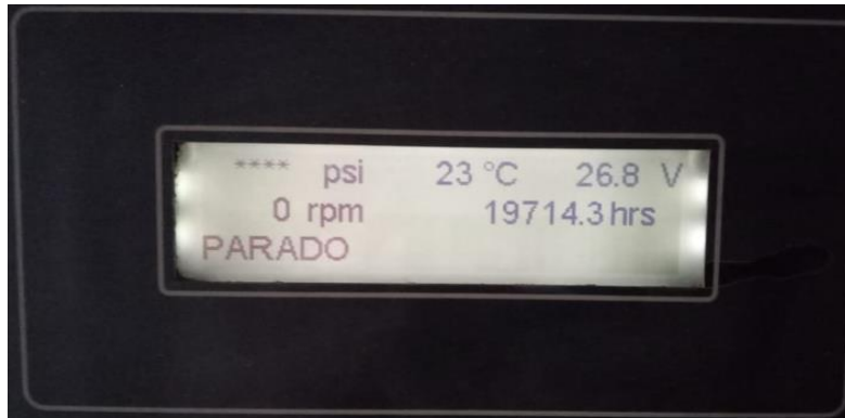
Figura 4.- Fotografía del horómetro de GEN°6 actualizado al 06.01.22

Nota: Se adjunta manual de Operación y Mantenimiento Grupo Electrónico C32