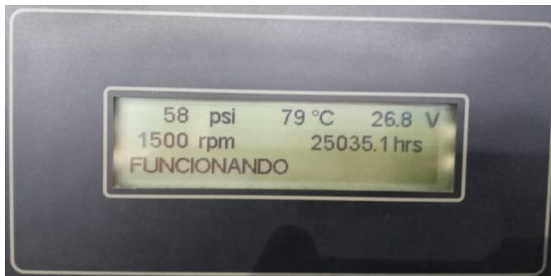
Figura 3.- Fotografía del horómetro de GEN°1 actualizado al 06.01.22

Nota: Se adjunta manual de Operación y Mantenimiento Grupo Electrónico C32