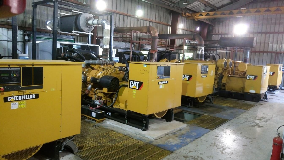
Figura 2.- Ubicación de los grupos electrógenos en la Central Mataveri

Las especificaciones técnicas del presente documento cubren en detalle los requerimientos para el servicio de mantenimiento preventivo de los grupos electrógenos de la Central Mataveri de la Isla de Pascua.